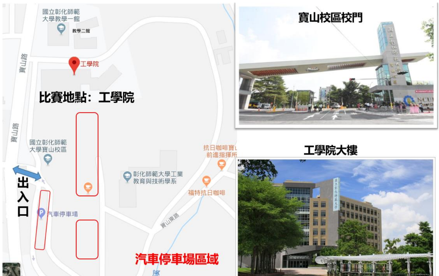
圖 6. 國立彰化師範大學寶山校區及停車場位置