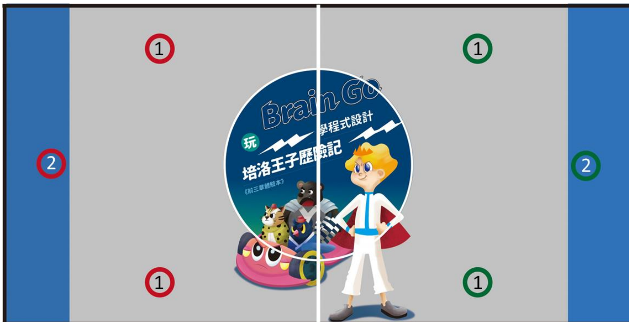
圖 3. 競賽場地示意圖(實際路線仍以當天場地為主)