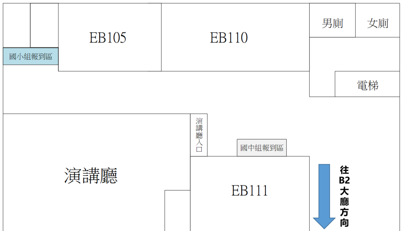
圖 7. 工學院 B1 競賽場地位置圖