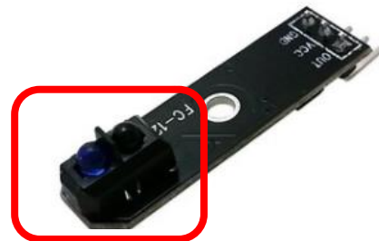
圖 2. 紅外線感應器